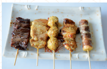
(511 ou M1)